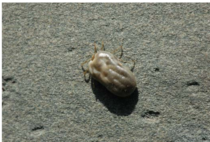
Femelle de tique ( Ixodes uriae ). Au stade adulte, seule la femelle se nourrit de sang.

Au vu de ces toutes nouvelles données, l'équipe souhaite développer deux axes par le futur : les implications du système immunitaire dans les stratégies d'utilisation de l'espace par les oiseaux, et celles des processus de coévolution entre hôtes et vecteurs dans les populations naturelles.