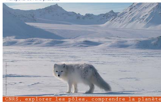
Renard polaire au printemps. La livrée blanche laisse place à une livrée d'été, plus sombre. Spitsberg, Norvège.