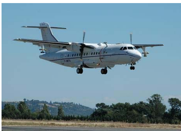
Avion français utilisé pour les mesures, l'ATR-42

Des stations de mesures installées au sol se consacrent à la surveillance sur le long terme : la station américaine SUMMIT située sur le plateau glaciaire du Groenland et la station PALLAS en Finlande. Ceci permettra de faire le lien entre des mesures très complètes mais sur une durée limitée avec des observations sur de longues périodes (plusieurs années).