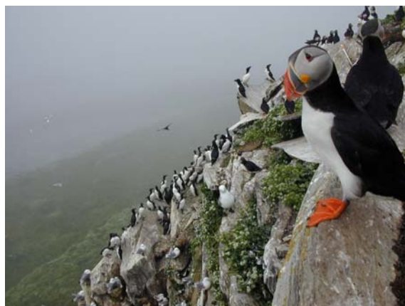
Colonie d'oiseaux de mer de la mer de Barents, en Norvège, avec un Macareux moine en premier plan

Le modèle d'étude est un système d'interactions hôte-parasite à trois niveaux, impliquant primo, les oiseaux de mer de l'Arctique comme hôtes, principalement la mouette tridactyle, deuxio, la tique des oiseaux de mer et, tercio, la bactérie Borrelia burgdorferi sensu lato , agent de la maladie de Lyme chez l'homme. Outre des analyses en laboratoire, l'approche