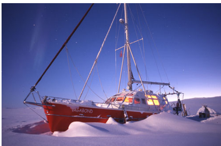
Le vagabond