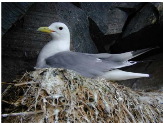
Mouette tridactyle sur son nid

C'est ce que les chercheurs du programme Parasito-Arctique 22 , piloté par Thierry Boulinier, 23 étudient, l'objectif étant de mieux comprendre le comportement des animaux face à la variabilité de leur environnement. Les questions abordées vont des mécanismes de choix du site de reproduction par les oiseaux, aux processus de coévolution entre hôtes et parasites. Comprendre ces mécanismes permet notamment d'identifier des phénomènes d'amplification de la réponse des populations animales à des changements environnementaux.