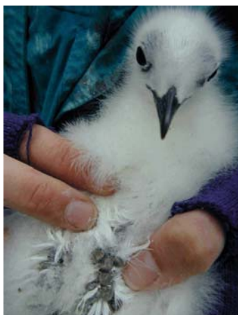
Poussin de mouette tridactyle parasité par de nombreuses tiques

L'étude de ce système a permis de mettre en évidence des effets complexes, en cascades, dans les relations entre hôtes et parasites. En particulier, chez la mouette tridactyle (l'une des espèces d'hôte), les mères transmettent à leurs jeunes, via leurs œufs, des anticorps contre les parasites auxquels ils sont susceptibles d'être exposés. Un tel processus pourrait jouer un rôle significatif dans l'écologie des interactions hôte-parasite. Un autre résultat important concerne la spécificité des relations entre la tique et ses hôtes. Contrairement à ce qui était pensé, des analyses génétiques (de l'ADN des tiques) ont permis de montrer que la mouette tridactyle et les autres oiseaux de mer ne sont pas parasités par la même population de tiques, même lorsqu'ils nichent au même endroit. Une telle spécialisation du parasite devrait affecter la circulation des organismes pathogènes qu'il transmet. Ces résultats ont des implications importantes, notamment dans le contexte de l'épidémiologie des maladies infectieuses émergentes.