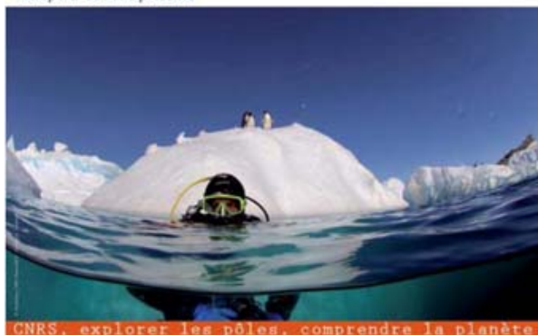
Scientifique en plongée, base Dumont d'Urville, Terre Adélie, Antarctique.